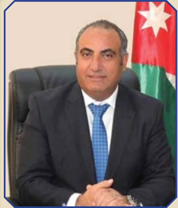
الدكتور يوسف عبد الله الشواربي أمين عام عمان الكبرى جائزة الثقافة الرياضية العربية التقديرية لعام ٢٠٢٤